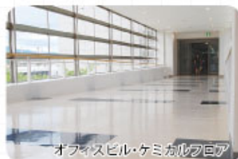
オフィスビル・ケミカルフロア