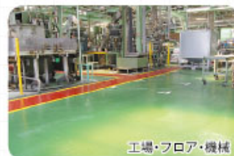
工場・フロア・機械