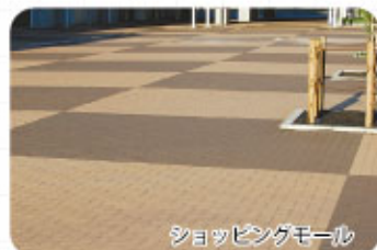
ショッピングモール

素材への影響を最小限に抑えてありますので、石材・タイル・金属・プラスチックなどに安心して使用できます。