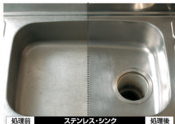
処理前 ステンレス・シンク 処理後